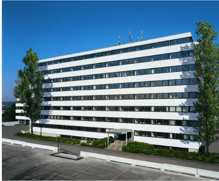
Firmengebäude MAIRDUMONT Frontalansicht MAIRDUMONT Standort Marco-Polo-Straße 1, 73760 Ostfildern/Kemnat