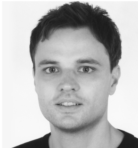
Gerald Drißner ©Autor, privat

Die DuMont Reiseabenteuer gibt es als gedrucktes Buch und als E-Book. Sie sind erhältlich im Buchhandel, überall, wo es Bücher gibt, sowie im Internet und im DuMont Online-Shop unter shop.dumontreise.de .